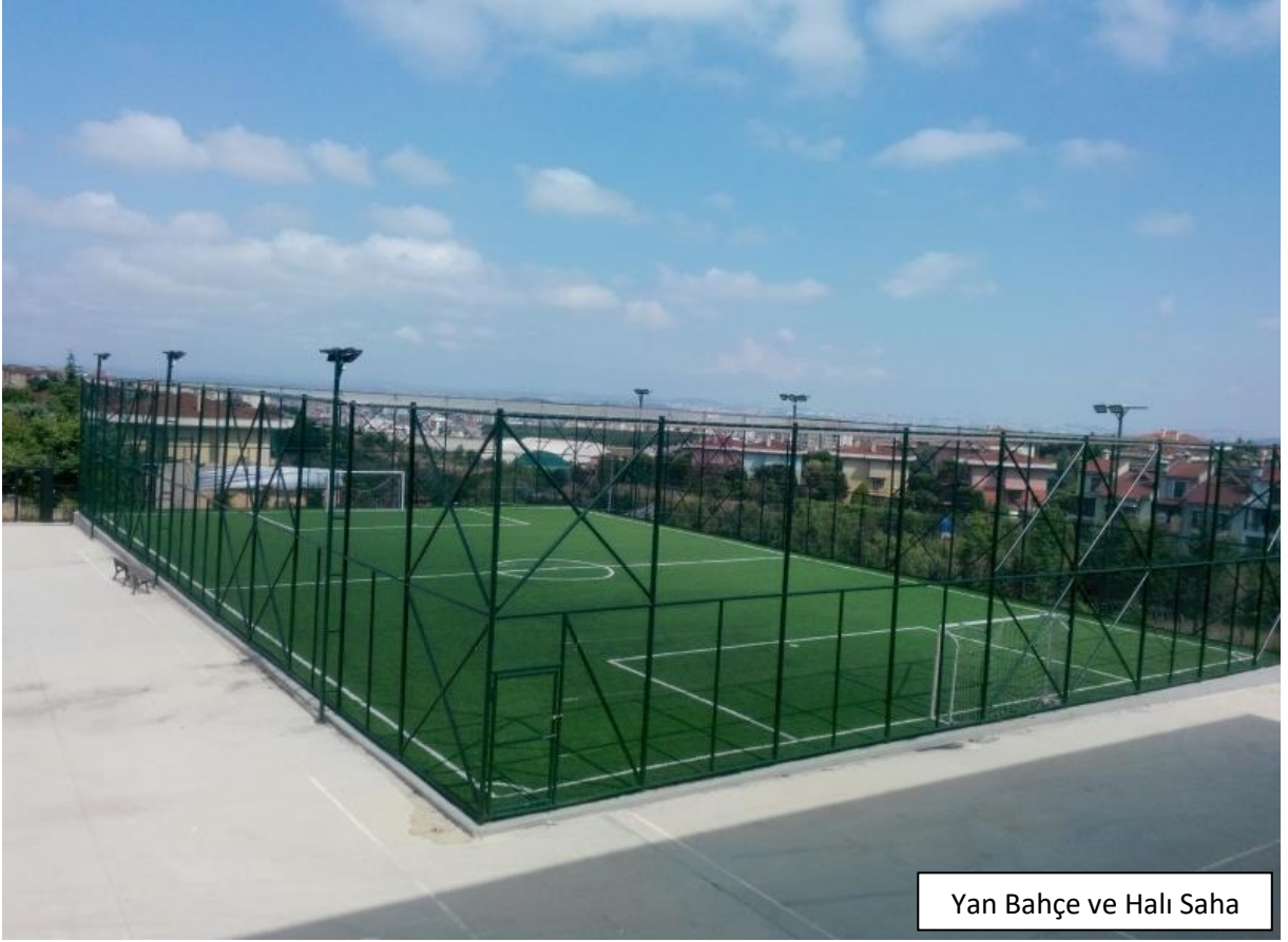
Yan Bahçe ve Halı Saha