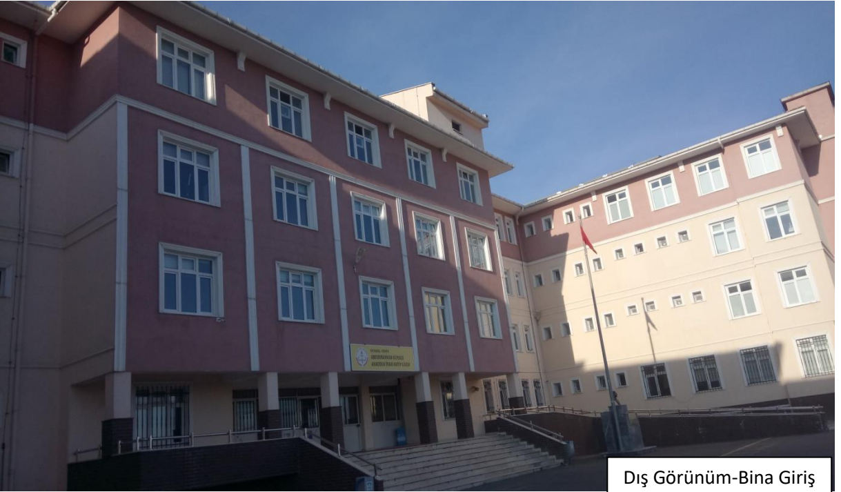
Dış Görünüm-Bina Giriş