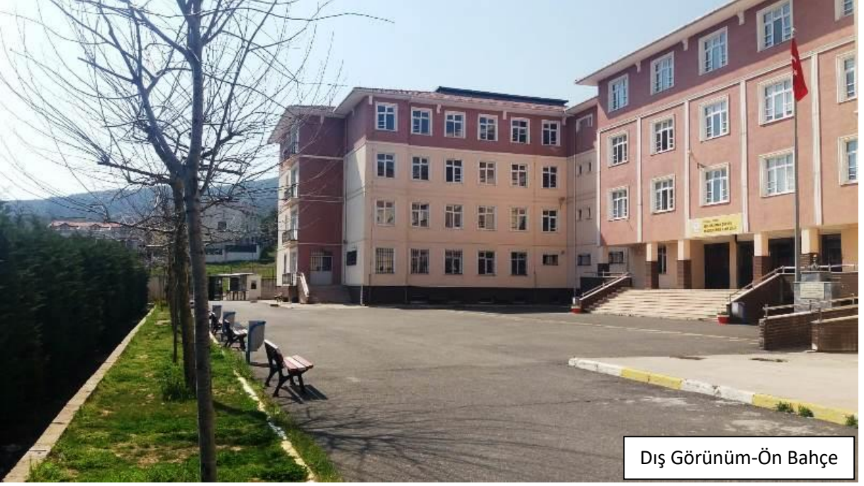
Dış Görünüm-Ön Bahçe