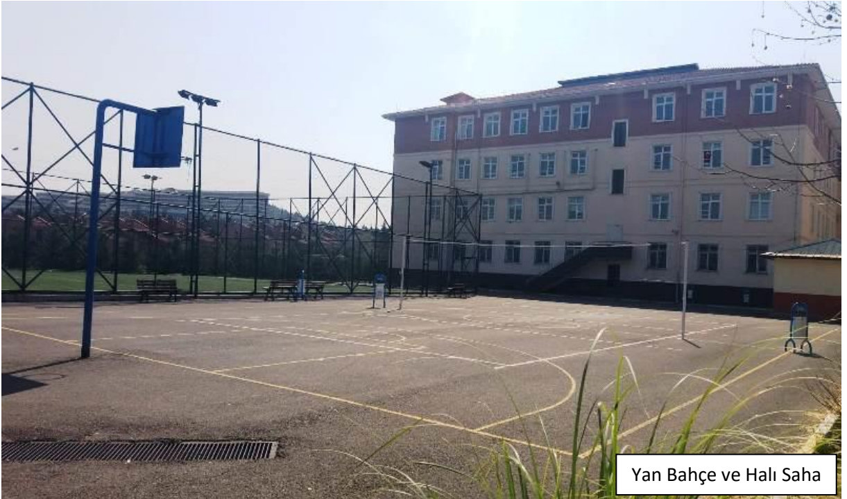
Yan Bahçe ve Halı Saha