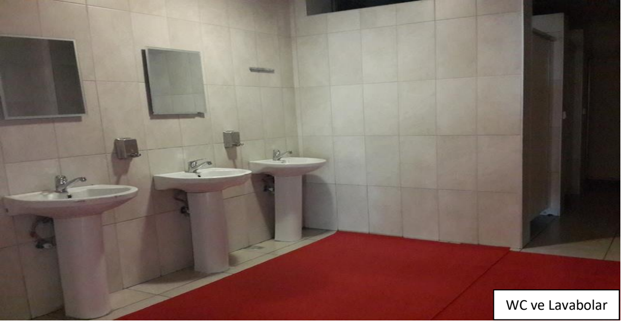
WC ve Lavabolar